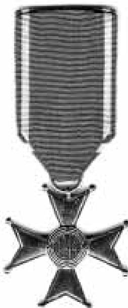
Krzyż Kawalerski Orderu Odrodzenia Polski – na zdjęciu rewers krzyża z datą 1944 r.