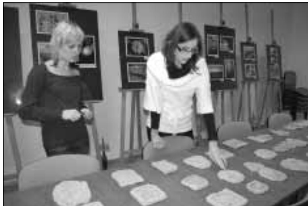
Jury ocenia płaskorzeźby.

dekoracji wiejskich kredensów i półek. Z kolei ludowe, rzeźbione i malowane kafle służyły do budowy pieców, zwłaszcza