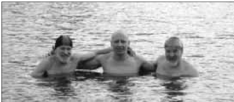
Założyciele Klubu Morsa.

morsach (artykuł z dnia 06.02.2009 „Rzeszowskie morsy na żwirow-