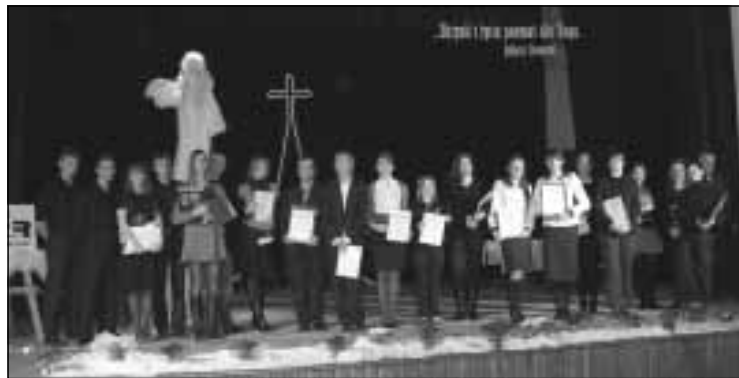
Laureaci Konkursu Poezji Religijnej.

Prezentowało się 37 wykonawców z całego województwa podkarpackiego w 3 kategoriach: recytacje, poezja śpiewana i drama. Byli nimi uczniowie szkół średnich i dorośli.