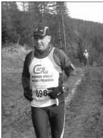
Na trasie biegu tuż przed 23 km

w Radziechowach, dłuższy zbieg do Radziechów i rozpoczyna się stopniowo wiodąca pod górę w Radziechowach, do