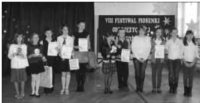
Nagrodzeni w kat Szkoła Podstawowa.