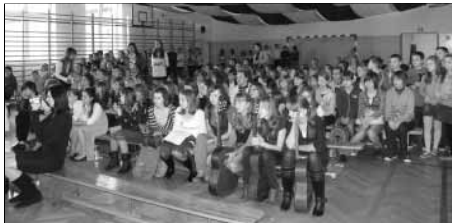
Liczenie zgromadzona na uroczystości publiczność.