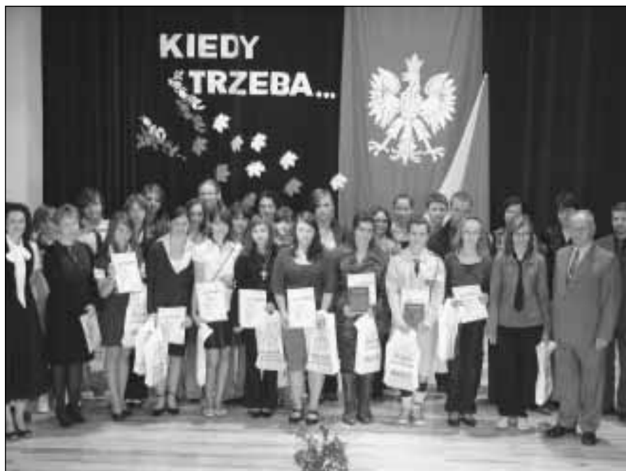
Wspólne pamiątkowe zdjęcie.