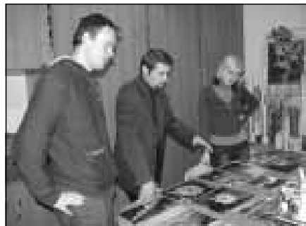
Jury ocenia nadesłane na konkurs fotografie.