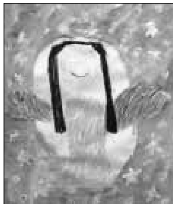
Anioł wykonany przez Olę.