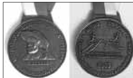
Medal upamiętniający start w Extrema maratonie górskim.