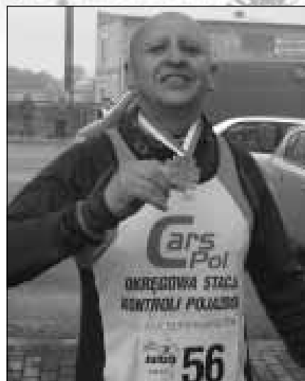
Medal i gratulacje kolegów.

Wybór szczęśliwego sponsora okazuje się bardzo trafny. Dru-