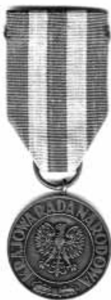
Medal Zwycięstwa i Wolności 1945 – awers. Jest to druga wersja medalu bity od 1946 r.