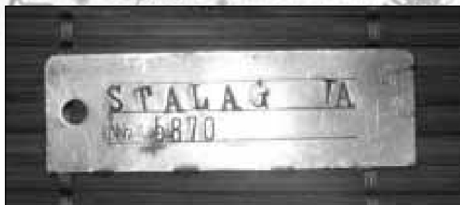
Jeden z nieśmiertelników używanych w stalagu IA gdzie był przetrzymywany Zdeb.

Po zakończeniu I wojny światowej służył jakiś czas w wojsku polskim. Jego jednostka została skierowana na wojnę polsko-ukra-