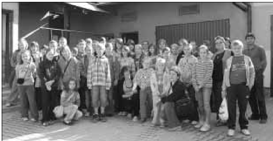
Uczestnicy Warsztatów przed Zakładem Wyrobu Kafil.